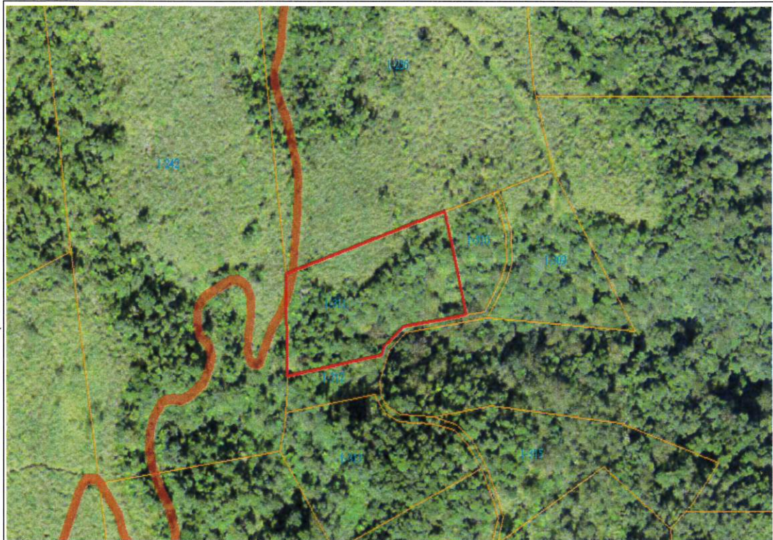
仲岳段 1-311 地號